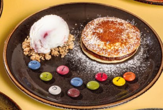
DORAYAKI DE XOCOLATA