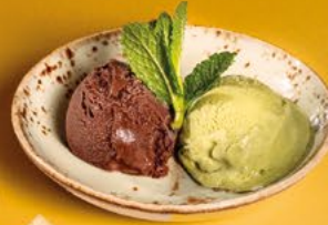
BINOMI DE GELATS