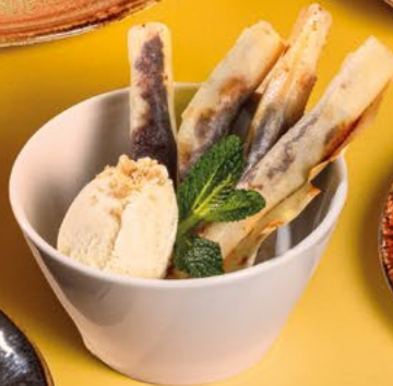
BANANA & CHO-CO