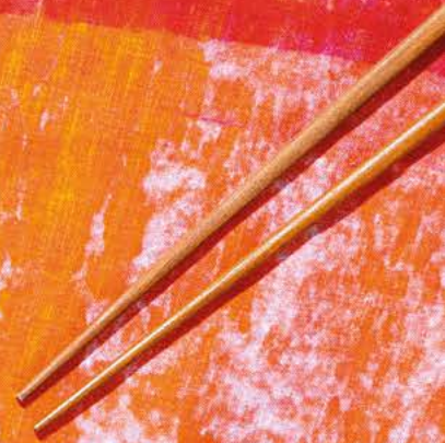
KAO DE PATO CON BOLETUS