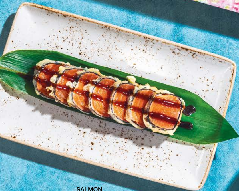
SALMON TEMPURA NORI