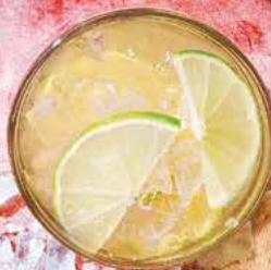
Llimonada de la casa