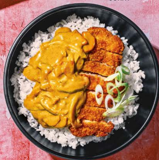
CHICKEN KATSU CURRY