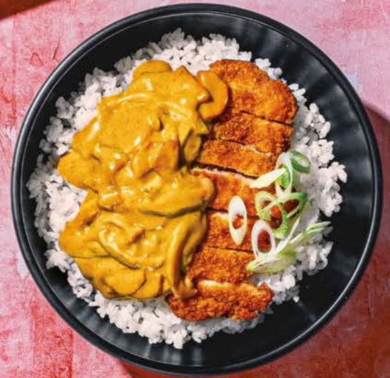
CHICKEN KATSU CURRY