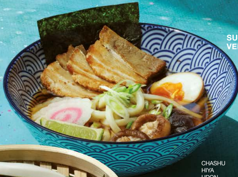
CHASHU HIYA UDON